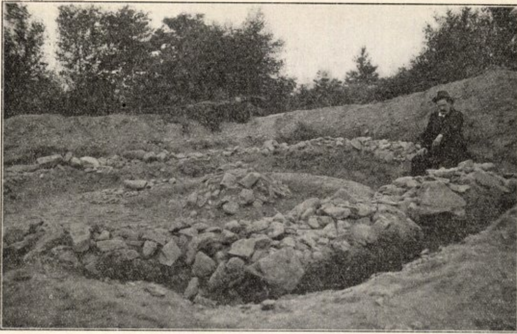
Fig. 2. Bronstijdgraf uit het Savelsbosch te Gronsveld, \pm 1800 v. Chr.

vóór en na Christus' geboorte in deze streken binnendrong.